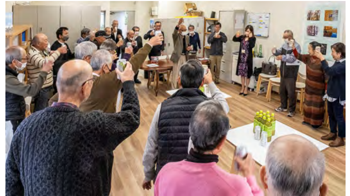
2022年11月24日 VS10周年の協力員懇親会を開催