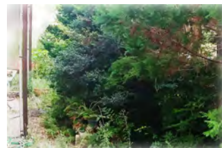
庭一杯に繁茂した状態

様々な事情で放置状態が続き、樹木が繁茂してご近所にご迷惑がかかる状態になってしまったお庭も、VSにご相談ください。空き家も対応します。詳しく見積りの上、ご満足いただけるようにしっかり整美します。