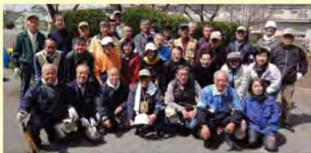
2015年3月 剪定講習会参加者

庭木剪定を中心に環境保全活動を展開、2015年度は、サービス実施件数が98件、協力員延人数は536人となる見込みです。利用者への満足度調査も実施、技術向上にも積極的に取り組み、より良いサービスの提供に向けて活動しています。最近では周辺地域からの依頼も増えています。