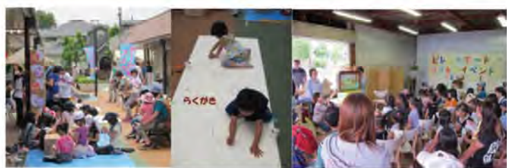
2013.6.1 「ふれあいイベント」