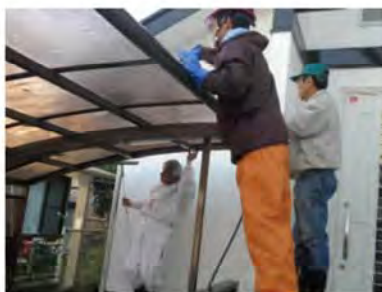
カーポート屋根拭き