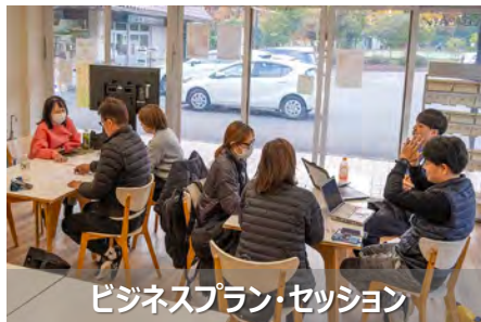
ビジネスプラン・セッション

今年度は、発表以後のイベントも企画し、確実にサイドビジネスがスタートするようにサポートしてまいります。