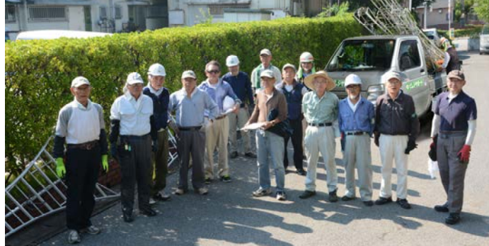
VS剪定団（愛称） 2018年8月 商店街の剪定作業