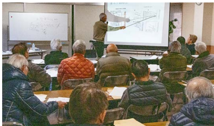
2019年2月 剪定ステップアップ講習 4回シリーズで実施

庭木が健やかに美しく育つように、樹木の生理を理解し、理にかなった剪定技術の習得と向上に努めています。2019年2月に専門家の指導でステップアップ講習を行いました。