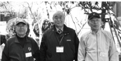
中央は花野井小学校の清水校長先生