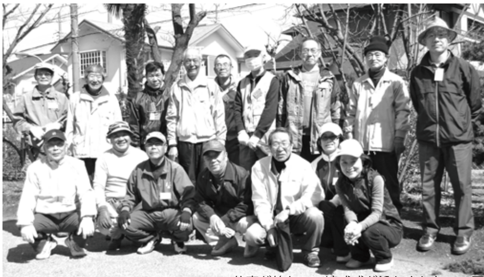
仕事が終わって達成感が溢れました 一同

初めはおずおずしていた“俄か庭師さん”達も少しの時間でかなりの勇気と自信に変わります。ほどなく小学校の清水校長先生がご挨拶を兼ねてご登場。温和な校長先生から各人にはにこやかに会釈の光景が。自分たちの子供が学んだ場所の植栽が、見る間に美しい植栽となり大満足の半日となりました。(M記)