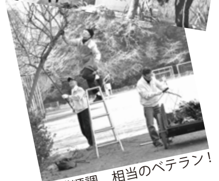
作業順調、相当のベテラン!