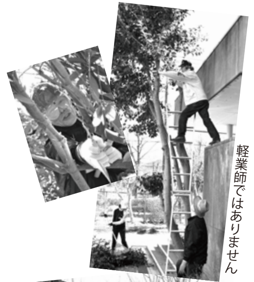
軽業師ではありません