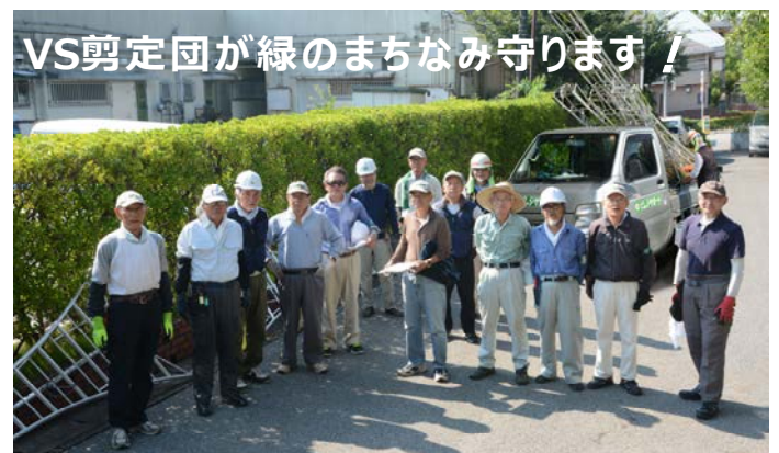
VS剪定団（愛称） 2018年8月 商店街の剪定作業