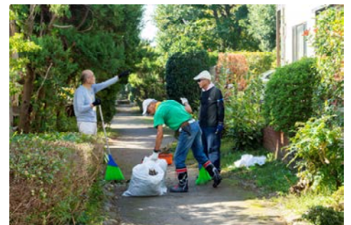
柏ビレジ授賞の記事

開発者が計画した美しいまちなみを住民が育むとともに、年月を経たニュータウンの様々な課題に前向きに取り組んでいる。