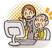
パソコン サポート