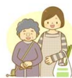
お買い物 サポート