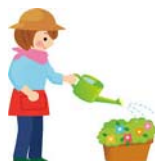
庭の草取り 留守中の水やり