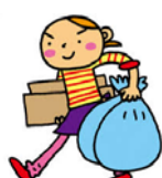
ゴミ出し ゴミ当番代行