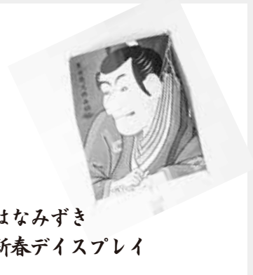
はなみずき 新春ディスプレイ